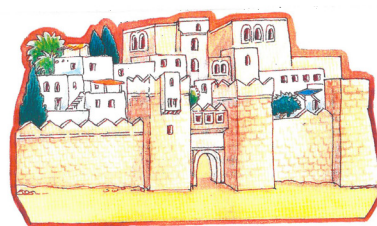
Exemple pour Jéricho